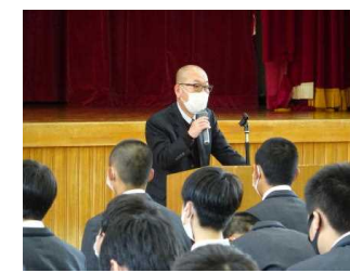
進路指導部長講話