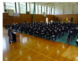
生活指導部長講話

4月14日(水)第1体育館において、高1オリエンテーションが実施されました。当日、2、3年生は春季遠足研修で市内を散策。生徒玄関前に体操服で集合する先輩方を横目に見ながら、通常どおり登校。まずは、JRC(青少年赤十字)加盟式から始まり、JRCの歴史や精神、3つの柱である「健康・安全」「奉仕」「国際理解・親善」の活動や態度目標である「気づき・考え・行動する」について理解を深めました。その後、学年主任、生活指導部長、進路指導部長、保健部長から講話をいただきました。正直遠足がうらやましいと思った人もたくさんいましたが、学校生活を送る上での大切な心得を聞き、落ち着いて高校生活のスタートが切れたようです。