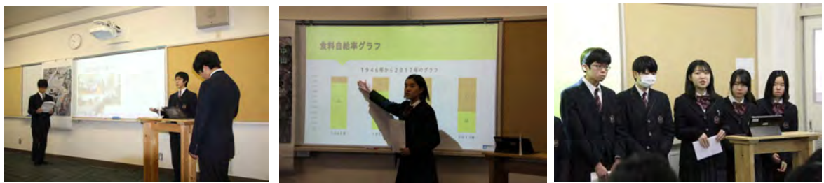
左から順に2班の国際交流、3班の米作り班、アラカルト班の発表の様子です。