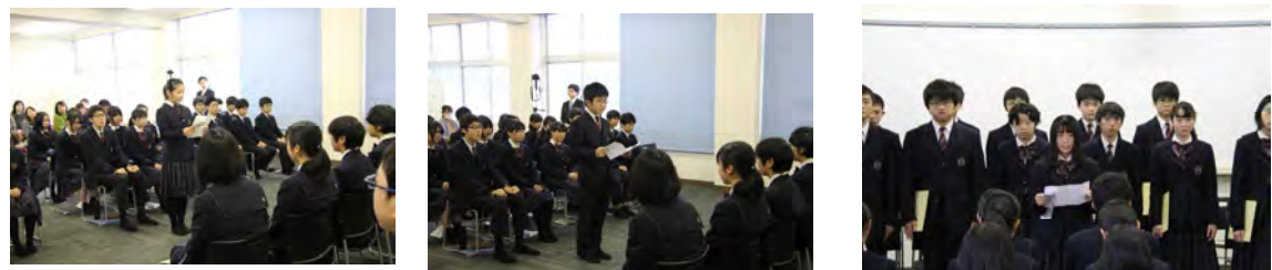
その後、2年生は立志の決意を行いました。各学年代表が言葉を述べている様子です。