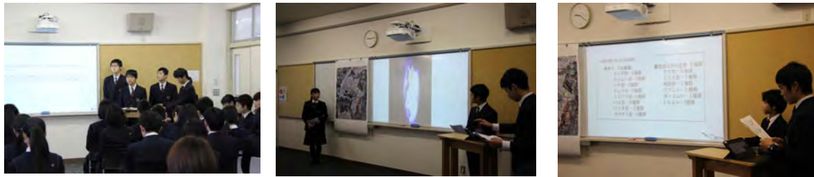
左から順に1班の水質調査班、微生物調査班、水中・陸上生物班の発表の様子です。