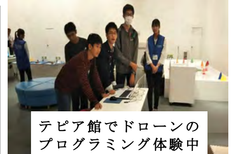
テピア館でドローンのプログラミング体験中

7日目と4日目に半日ずつあった班別行動では、東京大学や国会議事堂をはじめ歌舞伎座やカシオ計算機など4つのテーマに従い、公共の交通機関を利用して移動しました。2日目には貸し切りバスを利用して都内のおもだった場所を見学しました。今年、築地から豊洲への市場移転が話題になりましたが、2つを見比べることが出来、時代の移り変わりを感じました。またイングリッシュキャンプでは個性あふれる外国人講師の皆さんから楽しい指導を受けることが出来ました。