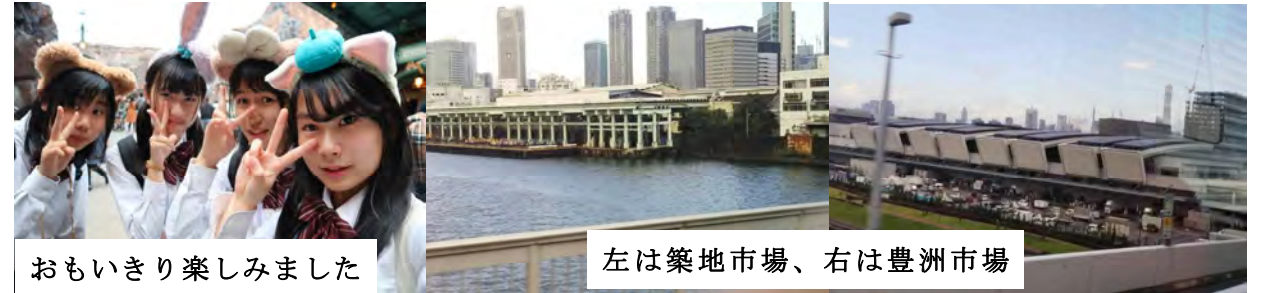
おもいきり楽しみました