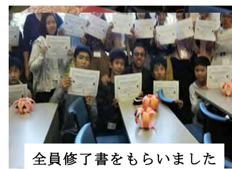
全員修了書をもらいました