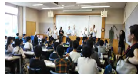
イングリッシュキャンプ講師紹介