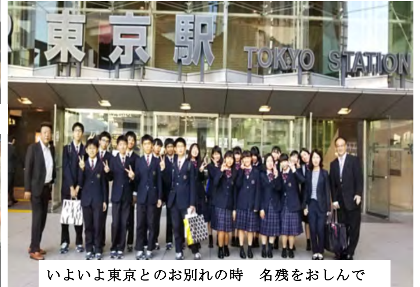
いよいよ東京とのお別れの時 名残をおしんで