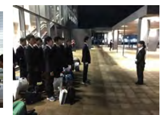
添乗員さんありがとうございました 解散式(敦賀駅前)