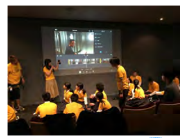
銀座アップル社で研修