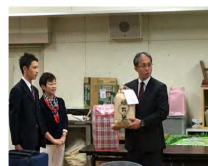
副校長先生に総合学習で作ったお米をお渡ししました。