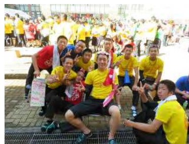
～文化祭2日目～ 野球部集合!