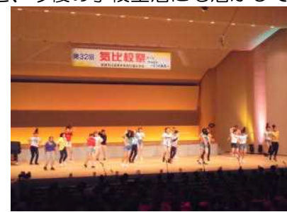
～文化祭1日目～ ダンス・チア同好会の発表