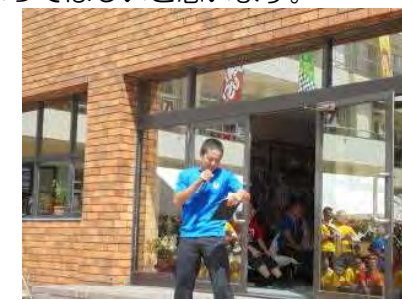
～文化祭2日目～ 中庭にて、のどじまん