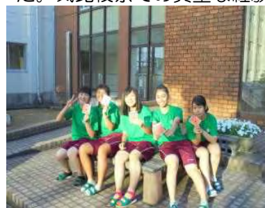
～前夜祭～ ビンゴ大会

8月31日(木)～9月2日(土)の3日間、第32回気比校祭を行いました。お越しくくださった保護者、卒業生の皆さま、どうもありがとうございました。3日間天候にも恵まれ、よい思い出となりました。気比校祭での貴重な経験を、今後の学校生活にも活かしていってほしいと思います。