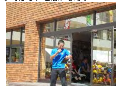
～文化祭2日目～ 中庭にて、のどじまん